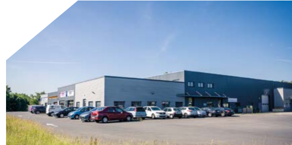
Hôtel d'entreprises Le Tarmac