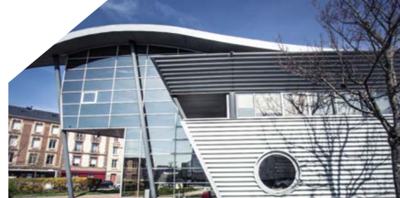
Pépinière d'entreprises Le Vaisseau