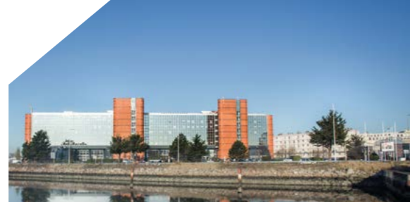
Le Centre Havrais de Commerce International