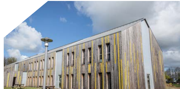
Pépinière Hôtel d'entreprises Le Drakkar - Parc Eco Normandie