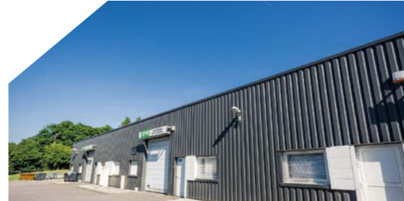
Hôtel d'entreprises Gustave Serrurier