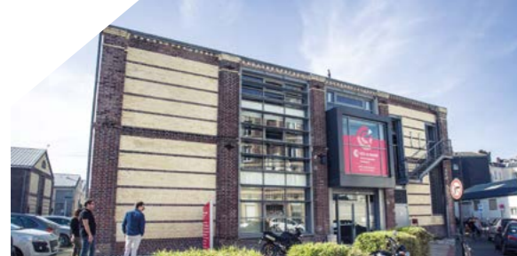
Hôtels d'entreprises Dombasle 1 & Dombasle 2