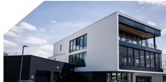
Hôtel d'entreprises Le Conquérant